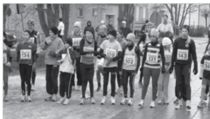
Innan start i Vallentuna – Nyårsloppet 2007