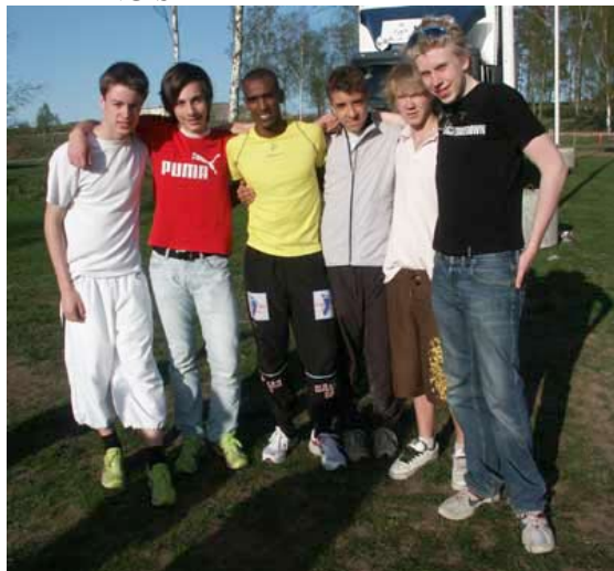
Möte med Mustafa Mohamed – Sveriges bästa löpare