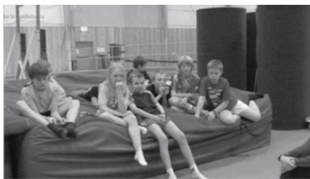
Gänget väntar på instruktioner...