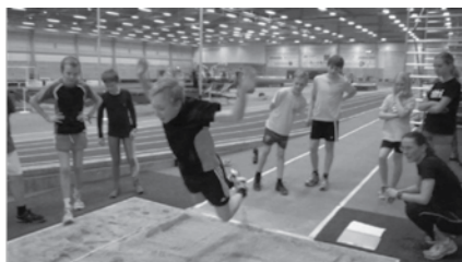
Test – stående längd...oooheeej!