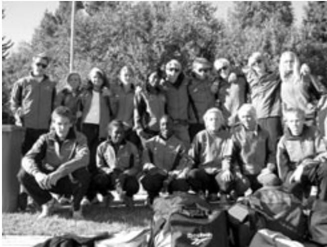
Några av våra duktiga FIG-elever